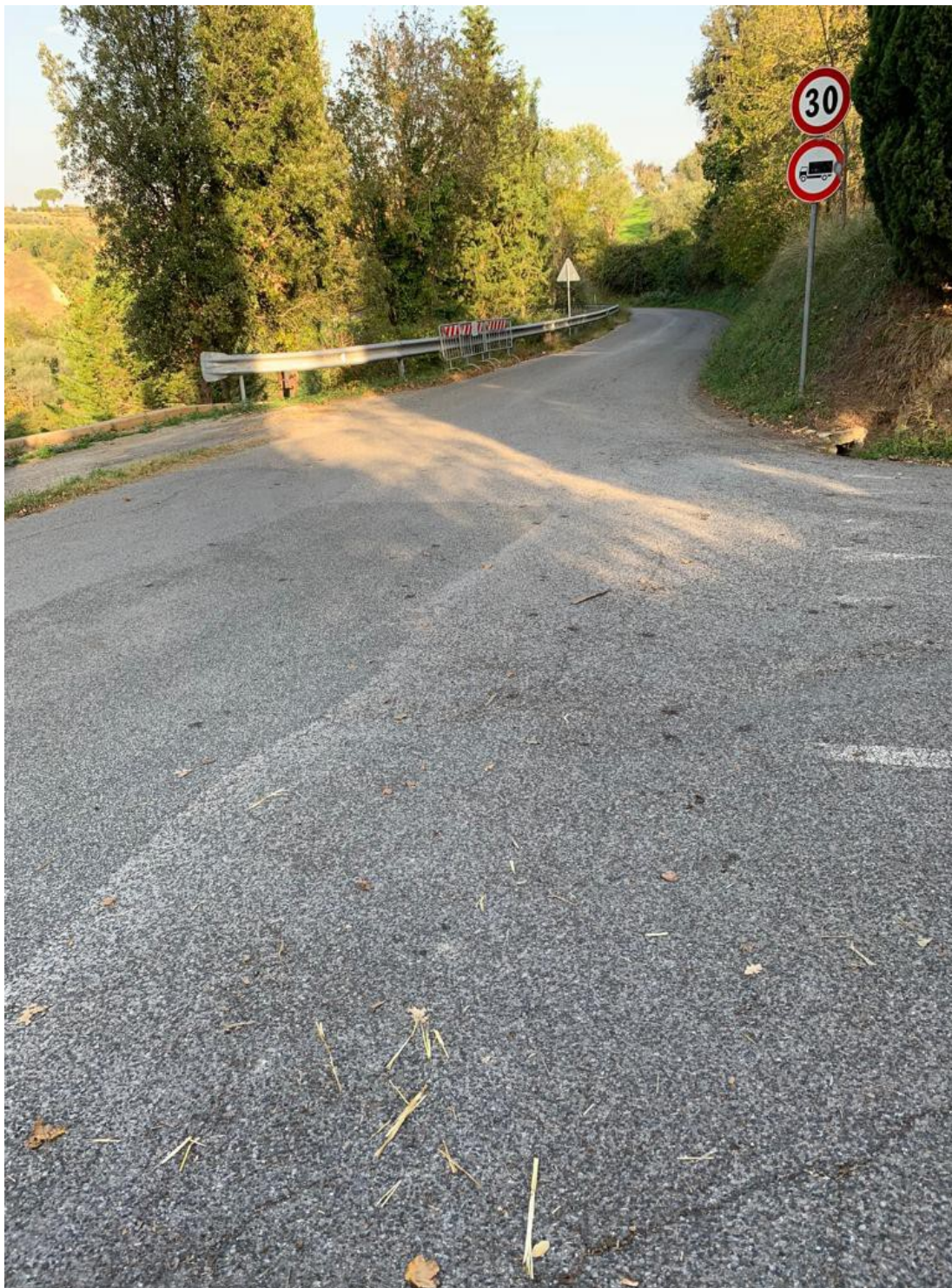
La partenza del percorso di Terrenzano

Protezioni punti critici della strada: è prevista la protezione dei punti critici del percorso con balle di paglia, gomme e tavoloni da muratore , percorso delimitato da transenne.