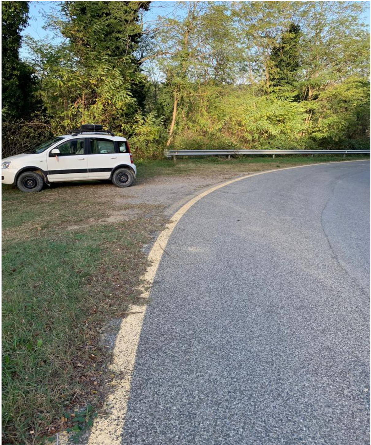
curva n. 3

Parcheggi: Si consiglia di parcheggiare nella zona di arrivo, in località Costafabbri, zona industriale Edilsiena, Citis situata a 300 metri dall'arrivo. In partenza c'è spazio per 15 autovetture.