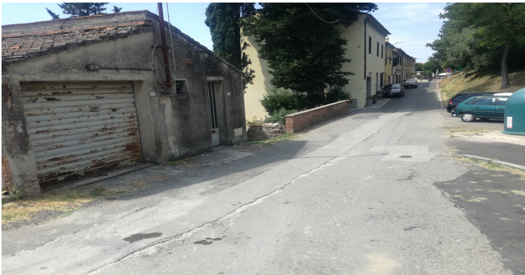
il tratto dove sarà ubicato il traguardo