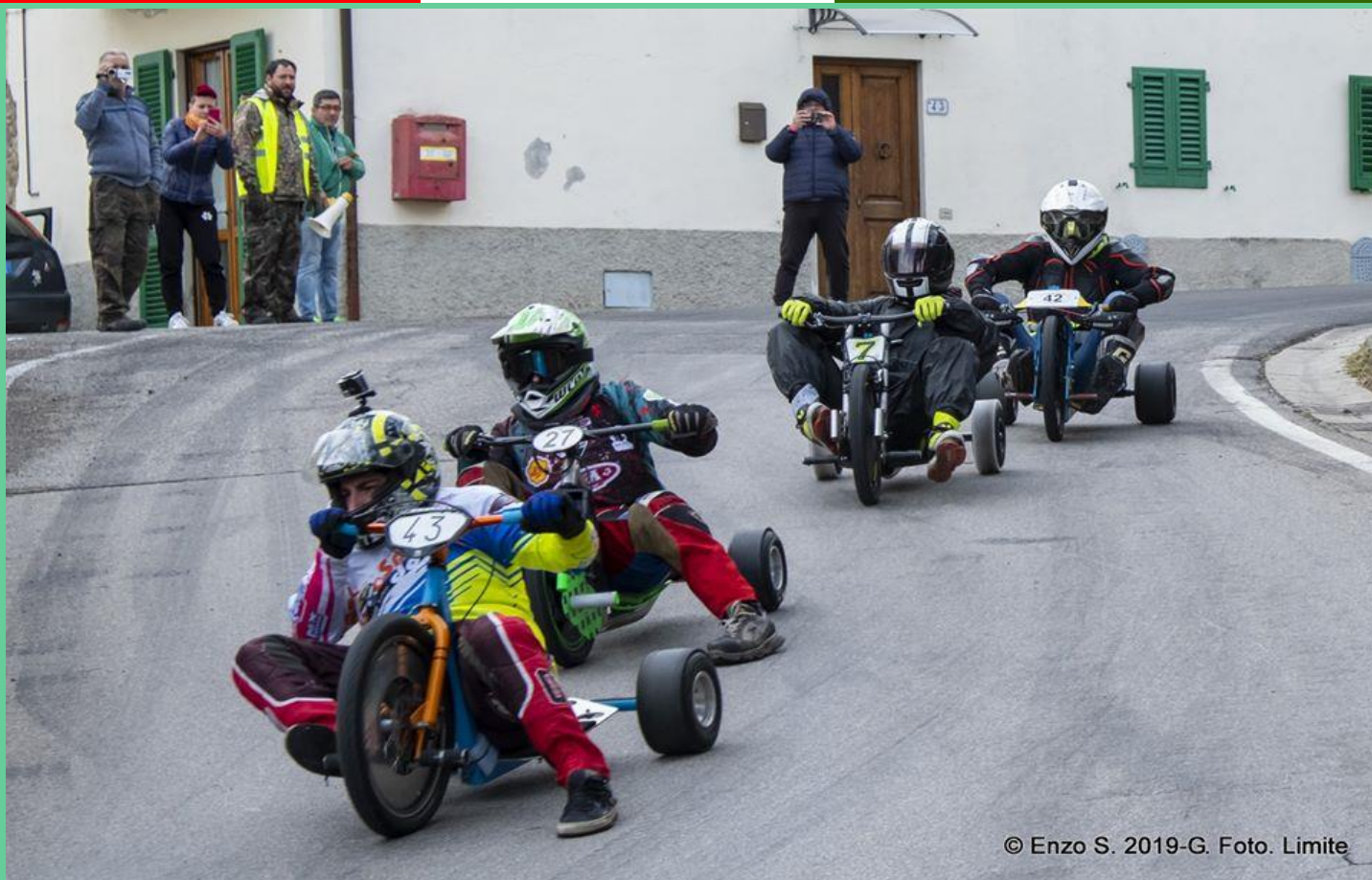
© Enzo S. 2019-G. Foto. Limite

CAMPIONATO ITALIANO DRIFT TRIKE - GRAVITY BIKE