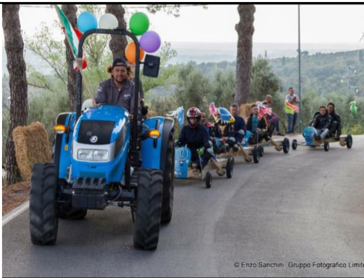
il tratto di Via Castra alla curva n°4